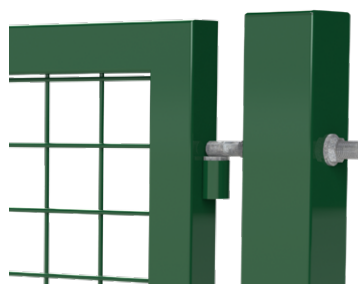
Gonds réglables Ouverture 90°